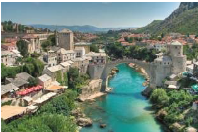
Bilder från arrangören i Hercegovina, hotell och Wikipedia

0414-440880 eller via www.busspersson.com